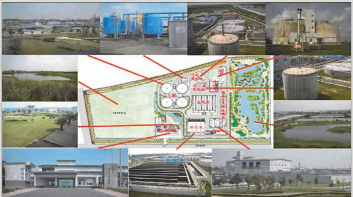
圖4 高雄市楠梓污水處理廠平面圖

估辦法規定，則得申請與甲方優先議約，以繼續營運及維護本計畫設施，以優先議約作為營運績效評估之誘因，促使民間機構落實營運管理單位之監督及管理工作，確保公共建設營運品質，發揮最大功能。