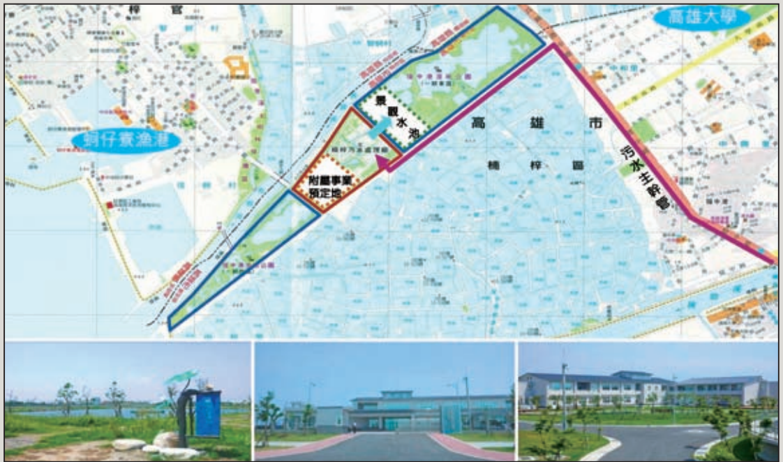
圖3 高雄市楠梓污水處理廠位置示意圖