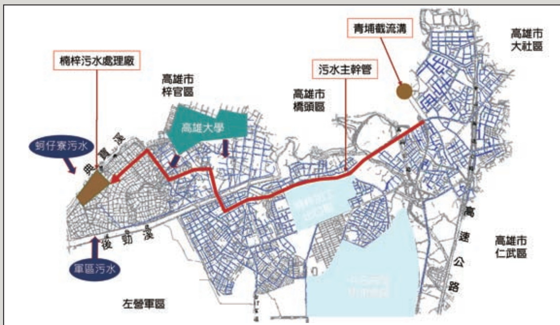
圖2 楠梓污水區位示意圖